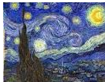
(Pintura “La noche estrellada”. Van Gogh)

En el arte y la moral hay estrecha relación, el arte existe necesariamente dentro de un marco de referencia de valores morales, pero a su vez el arte representa un medio para realizar la crítica de los valores morales establecidos. El artista es en cierto modo, inadaptado, audaz, destructor de prejuicios, a veces se adelanta a su tiempo y con fina sensibilidad da forma artística a los cambios que se dan en los patrones morales de la sociedad, y su obra actúa sobre las mentalidades.